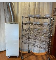
【食器はすべて使い捨てて使用しました】