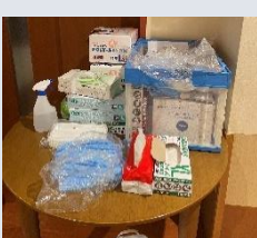
【消毒液やガウン、手袋などを部屋ごとに設置】