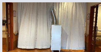
【昨年購入した大型空気清浄機を共有部に設置】